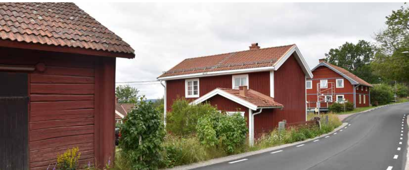
Många bostadshus i byn är moderniserade bland annat genom fönsterbyten, eller färgbyten under 1900-talet eller 2000-talet. Romma 15:5.