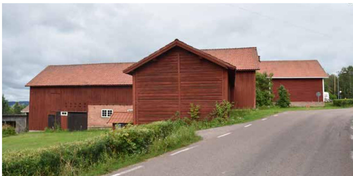
Stora ekonomibyggnader från 1800-talets slut eller 1900-talets början i Östra Backen. Romma 4:11.