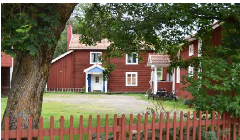
Kringbyggd gård med två äldre bostadshus. Byggnaden i bakgrunden har fortfarande värdefulla äldre detaljer så som fönster och farstukvisiten. Romma 11:6.