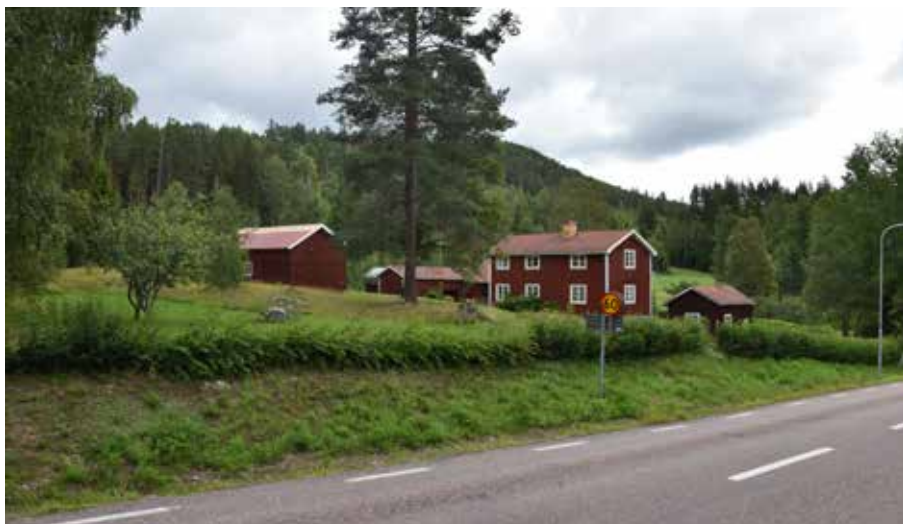
Gården längs västerut i byn, längs Sägmyravägen mot Hisvåla-Grytberg. Romma 6:14.