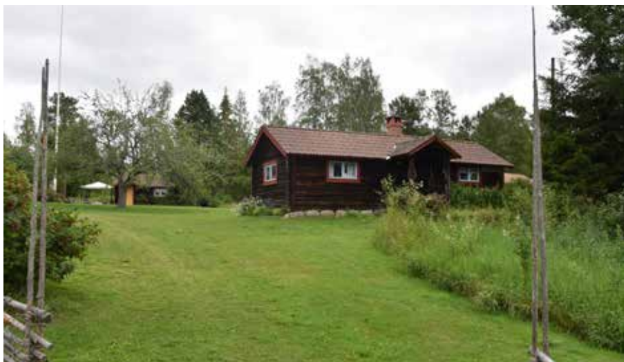
Ett modernistiskt/nationalromantiskt timmerhus, sannolikt uppfört under 1930- eller 1940-talet utformat som en parstuga. Romma 11:10.