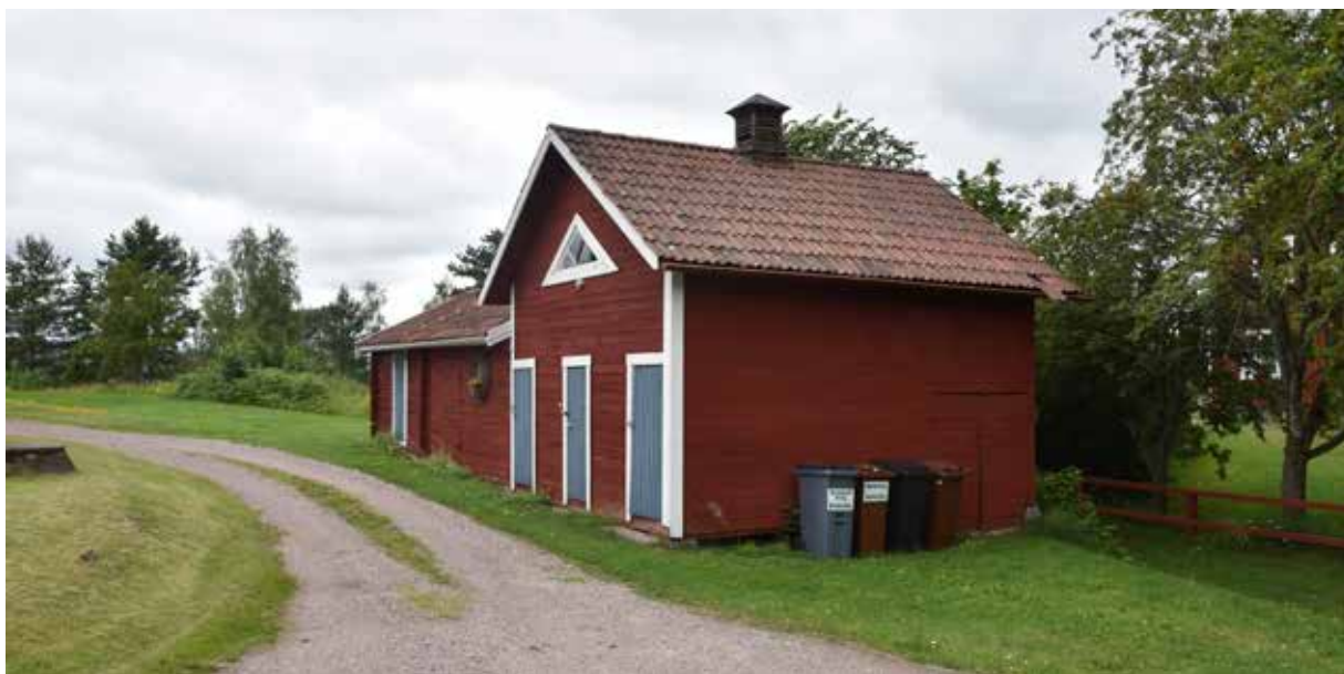
Detaljer i parisierblå färg finns även på nyare och mindre hus. Romma 14:4.