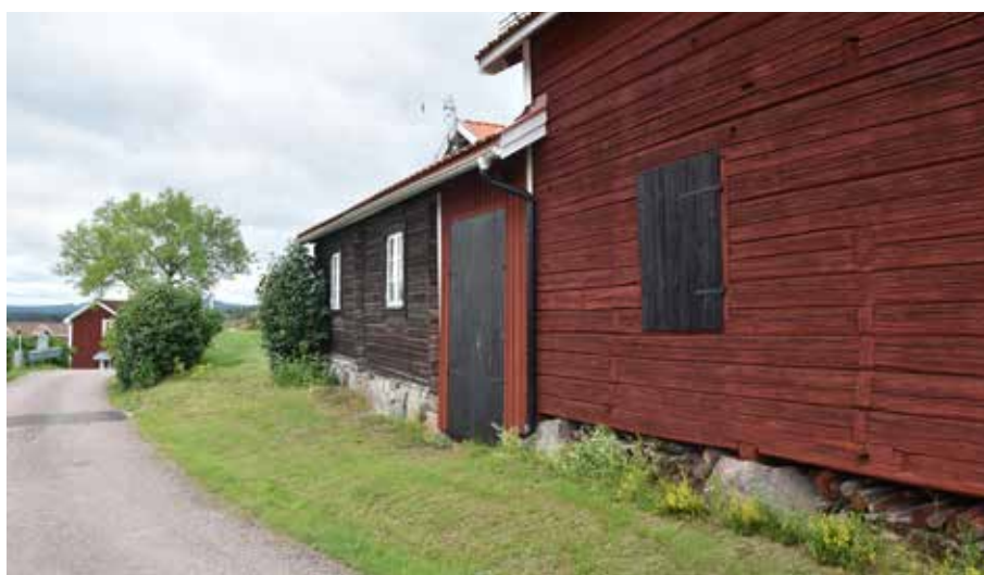
Timmerhus vid byvägen i Utabacken. Romma 8:7.