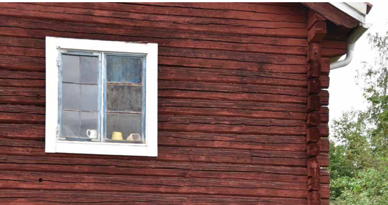
Ålderdomligt parisierblått och blyspröjsat fönster med mycket höga kulturvärden. Romma 11:6.