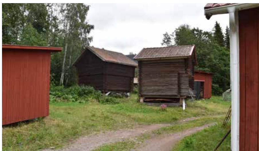
Härbresamling i Ovabacken. Romma 11:6.