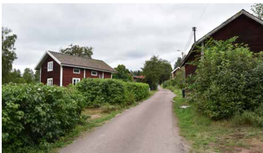
Backen mellan Ovabacken och Utabacken. Romma 7:10.