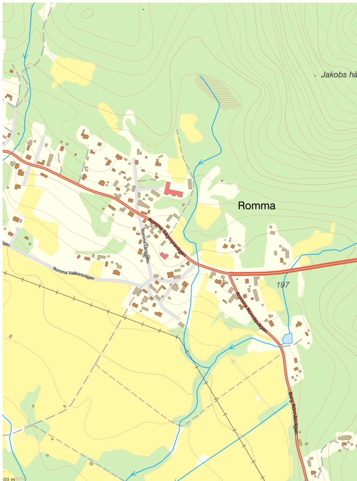
Hisvåla-Grytberg är högt beläget i östra delen av Leksands kommun.