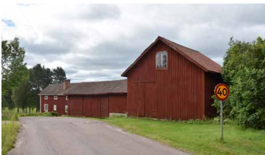
Större rödfärgade ekonomi-byggnader i Östra Backen. Romma 4:II.