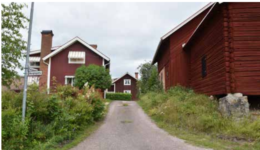
I Utabacken är bebyggelsen tät och sluten. Många bostadshus är dock förändrade under 1900-talet. Romma 5:8.