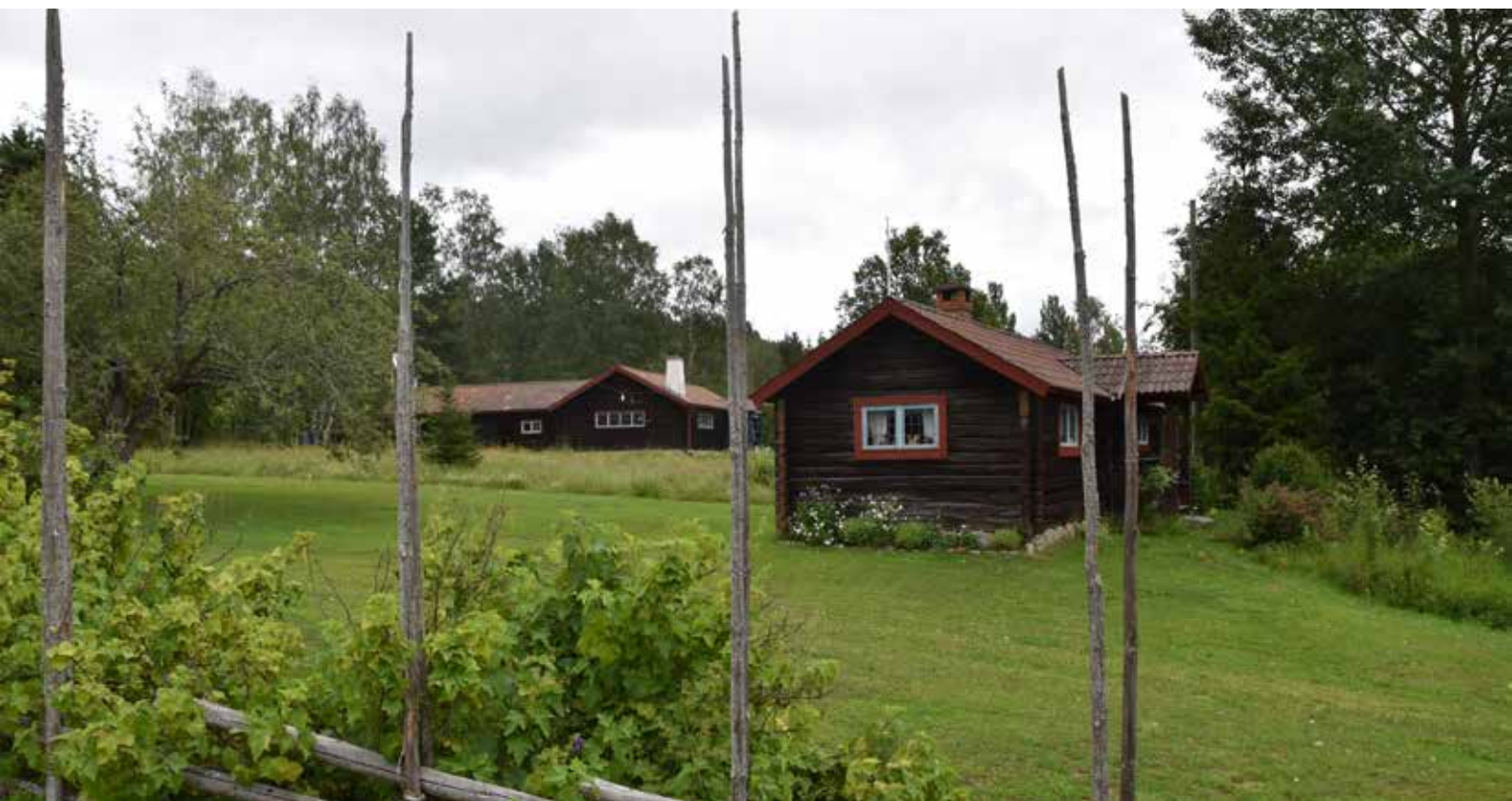
Modernistiska timmerhus i Ovabacken. Tomten avgränsas från byvägen av gärdesgårdar. Romma 11:10.