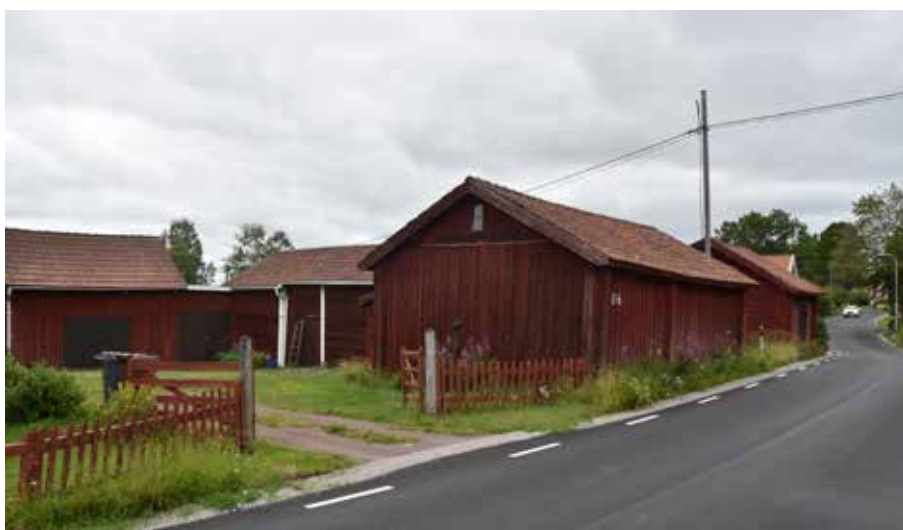
Delvis kringbyggt gårdstun med ålderdomliga timmerhus. Romma 15:6.