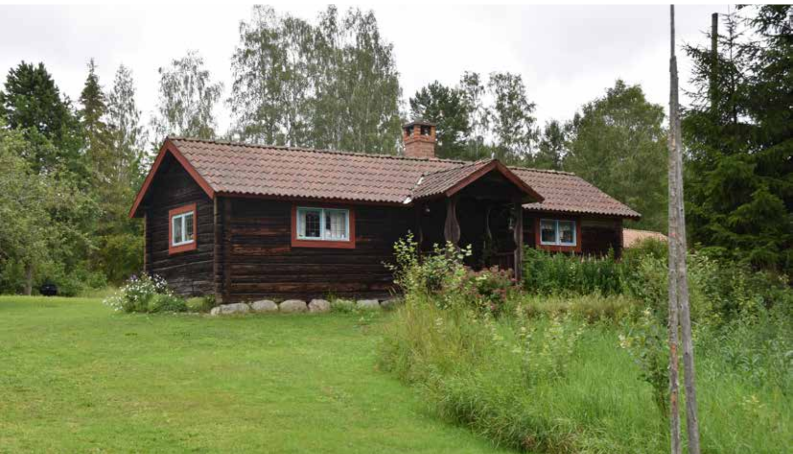
Parstuga uppförd under 1900-talet som bedöms ha särskilt kulturvärde eftersom byggnaden kan berätta om hur den äldre timmerhuskulturen omtolkades och traderades in på 1900-talet. Romma 11:10.