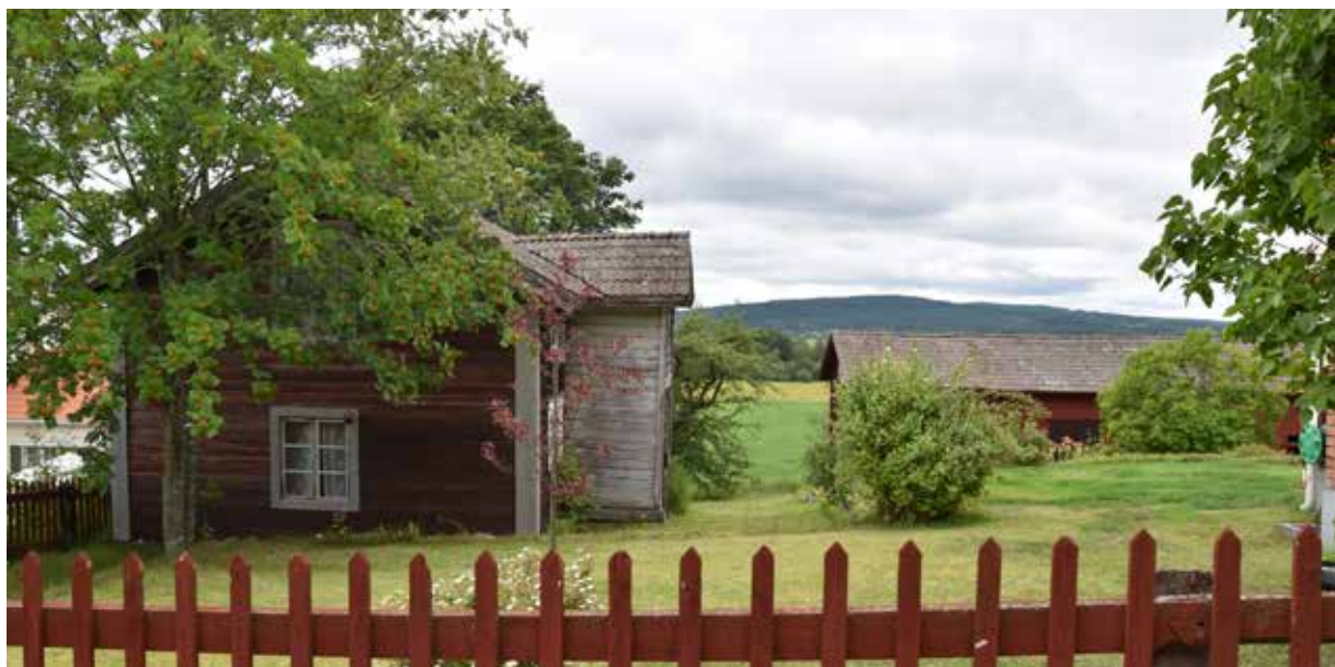
Äldre enkelstuga eller sidokammarstuga med framskjutande fästukvist. I bakgrunden det öppna odlingslandskapet mot Österdalälven. Romma 5:8.