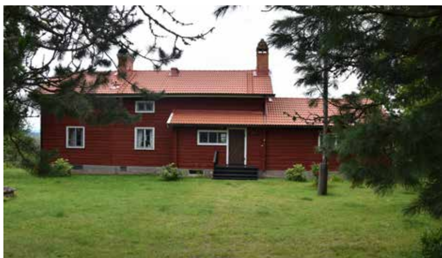
Dalaromantiskt eller modernistiskt sommarnöje i byns västra del. Romma 10:7.