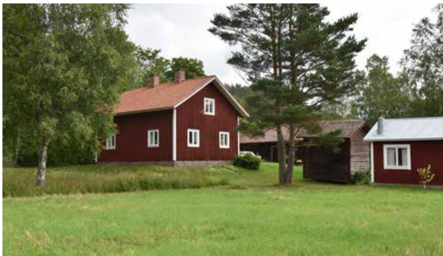
Dubbelkorsplanshus i Östra Backen. Liksom många andra manbyggnader i Romma har byggnaden moderniserats under 1900-talet, bland annat genom fönsterbyte. Romma 12:1.