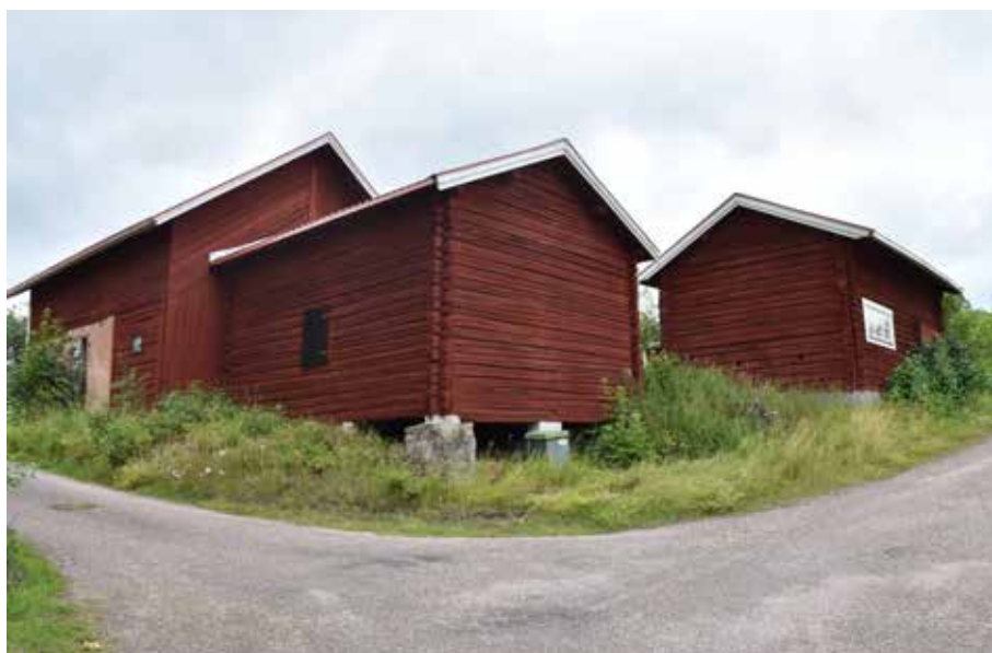
Kringbyggd gård med tröskladan på bilden ovan i Utabacken. Romma 3:7.