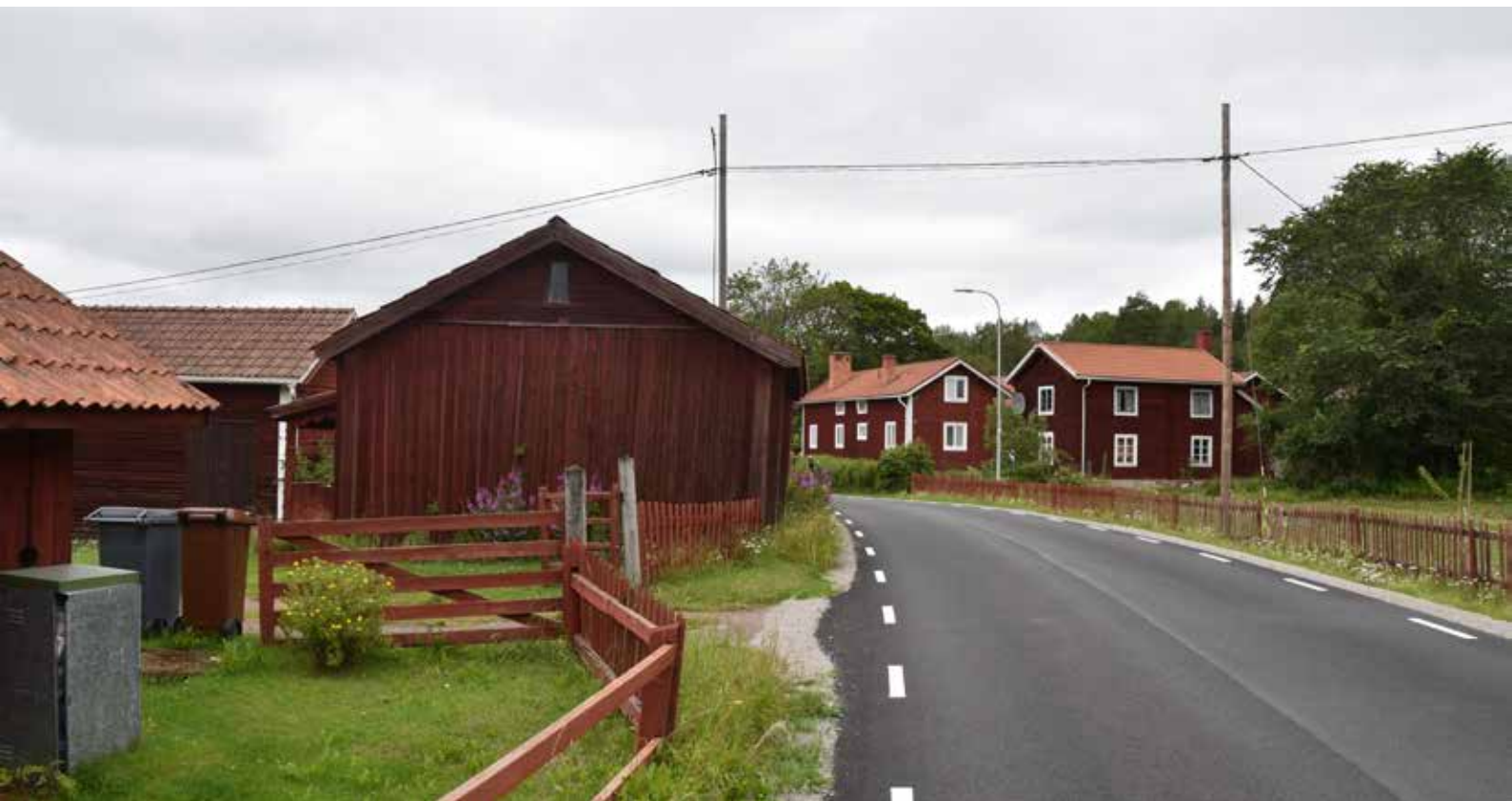
Bebyggelse längs Sägmyravägen. Till vänster finns delvis kringbyggda gårdar med ålderdomliga timmerhus. Till höger en gård med ålderdomlig enkelstuga. Romma 11:6.