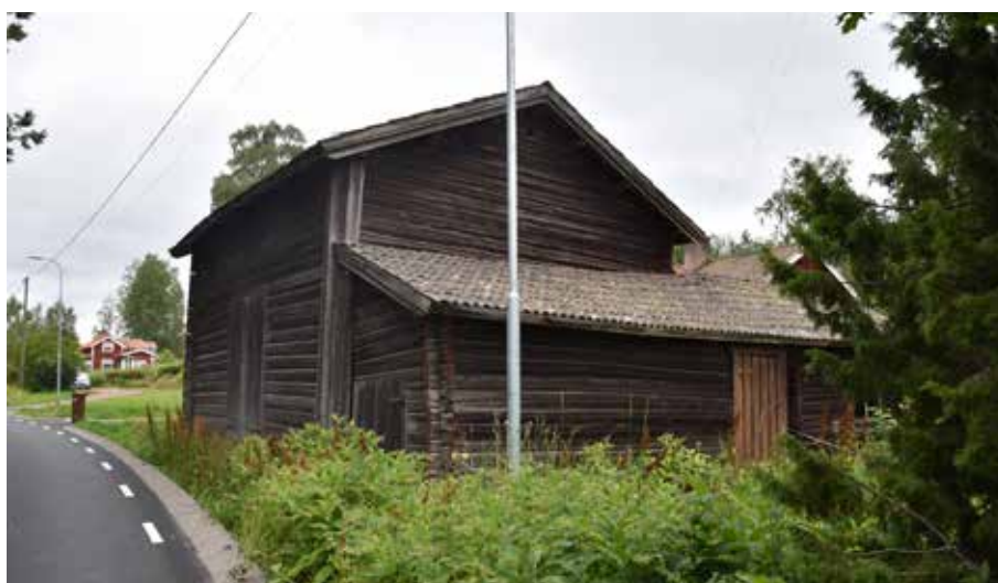
Ofärgad tröskloge i byns västra del. Romma 1:5.