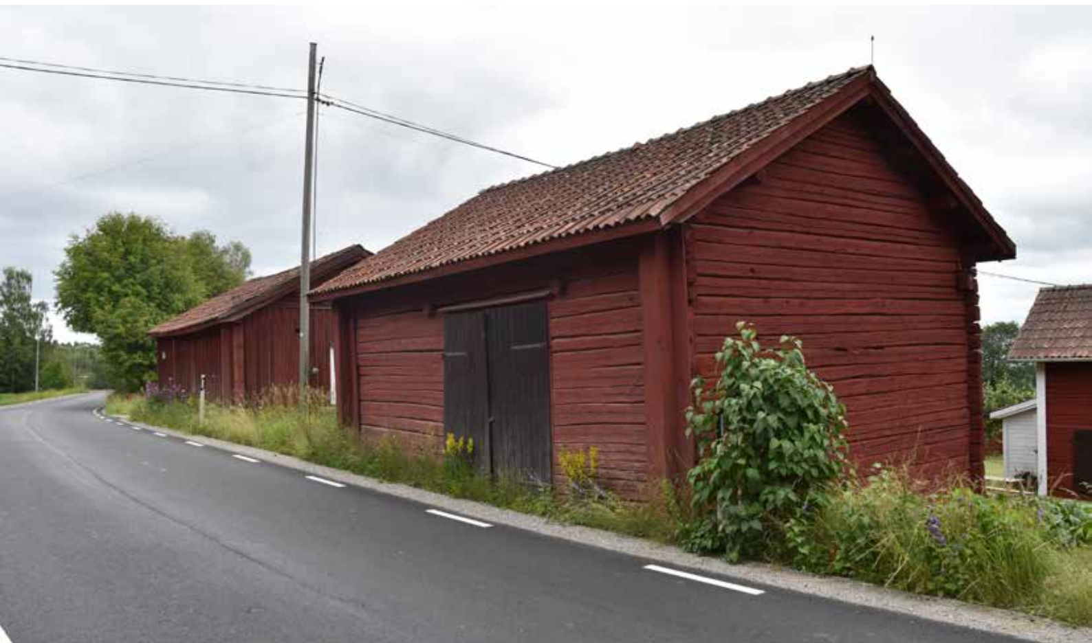
Trösklada i timmer invid Sägmyravägen. Romma 15:5 och Romma 15:6.

Kringbyggd gård med ålderdomliga timmerhus. längst upp från vänster: hölada, parstuga (bostadshus), långsideshärbre, källarstuga, loftbyggnad med portlida, vagnsbod sammanbyggd med kortsideshärbre, tröskloge, brunn, stall, torkhus, smedja, lada och fähus med portlida och dyngstad.