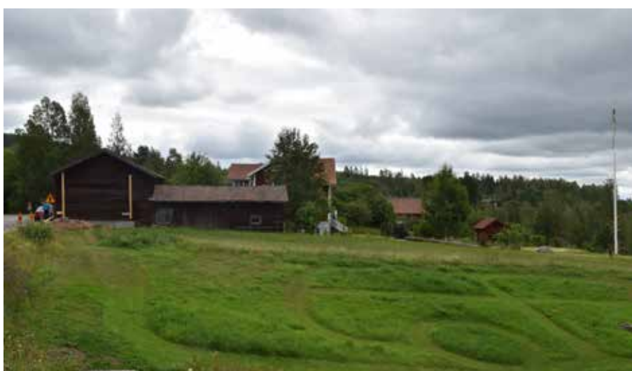
Ova och Utabacken avskiljs från Östra backen av en åsgrav som löper från Romberget. Mellan byklungorna finns flera ytor med småbruten odlingsmark som återspeglar det komplexa ägosystemet i Leksand i äldre tider. Romma 2:12.