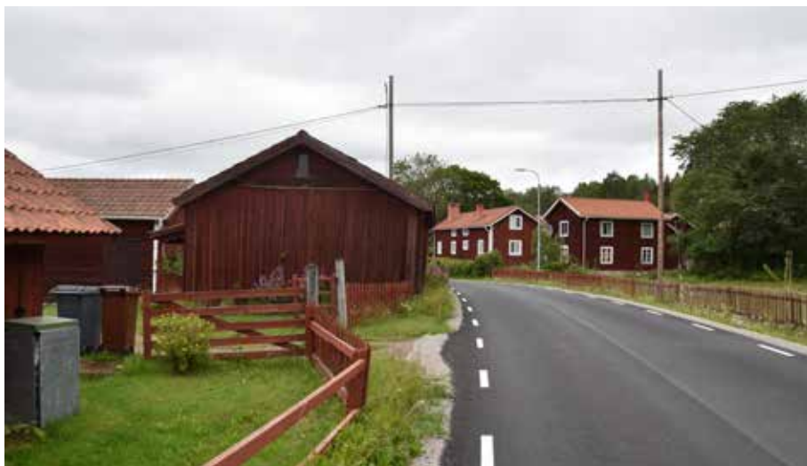
Vy längs Sägmyravägen västerut. Romma 11:6.