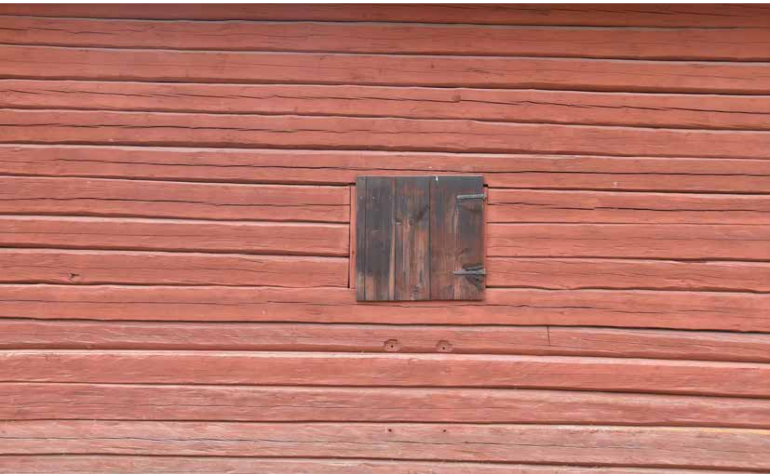
Timmervägg på äldre trösklada. Nästan alla hus i byn är faluröda.