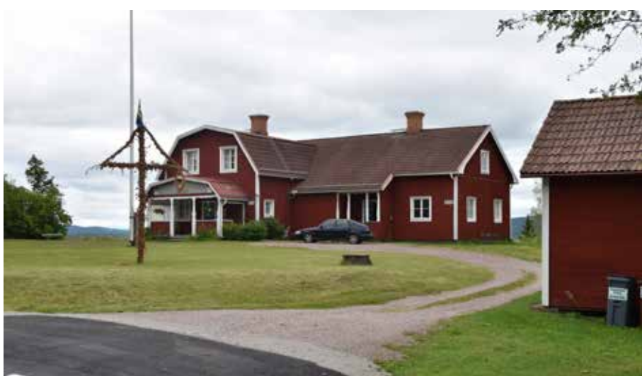
Den karakteristiska bystugan som tidigare var byskola. Den ena färstukvisten är rosmålad. Romma 14:4.