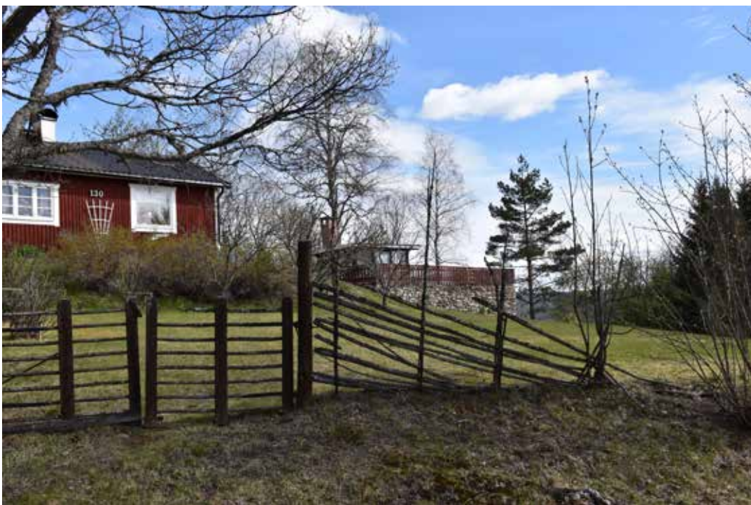
Bostad av modernare slaget med en stor stensatt terrass med så kallade bruksmurar. Östra Rönnäs 17:14.