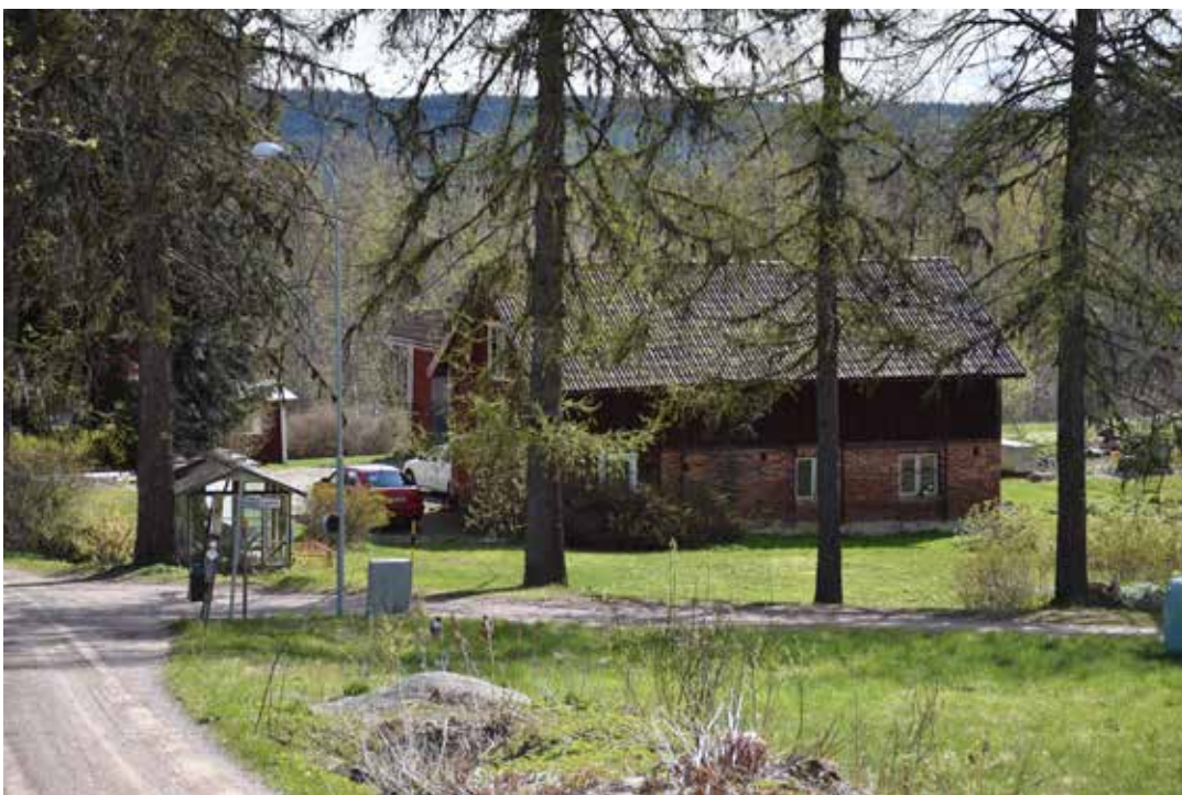
Ladugård med bottenvåning av tegel och höloft i rödfärgat trä. Tibble 29:11.