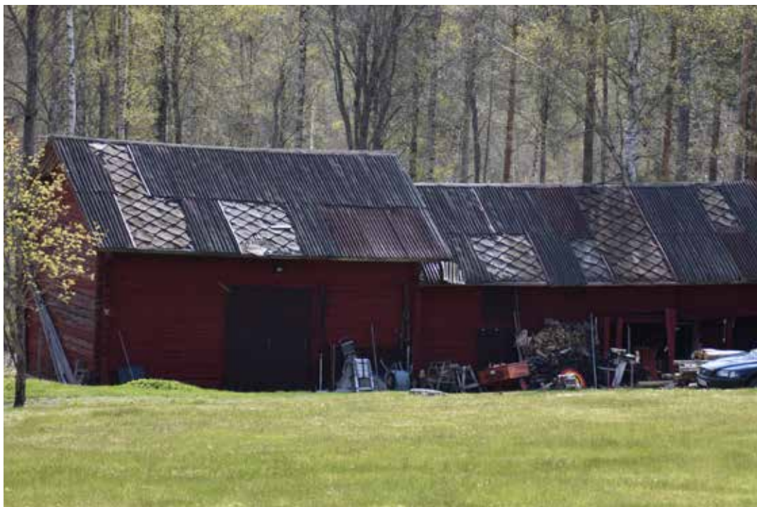
Äldre ekonomilänga. Där plåtskivor ramlat av skyntar ett äldre tak, troligen av rombformad masonit. Tibble 23:9.