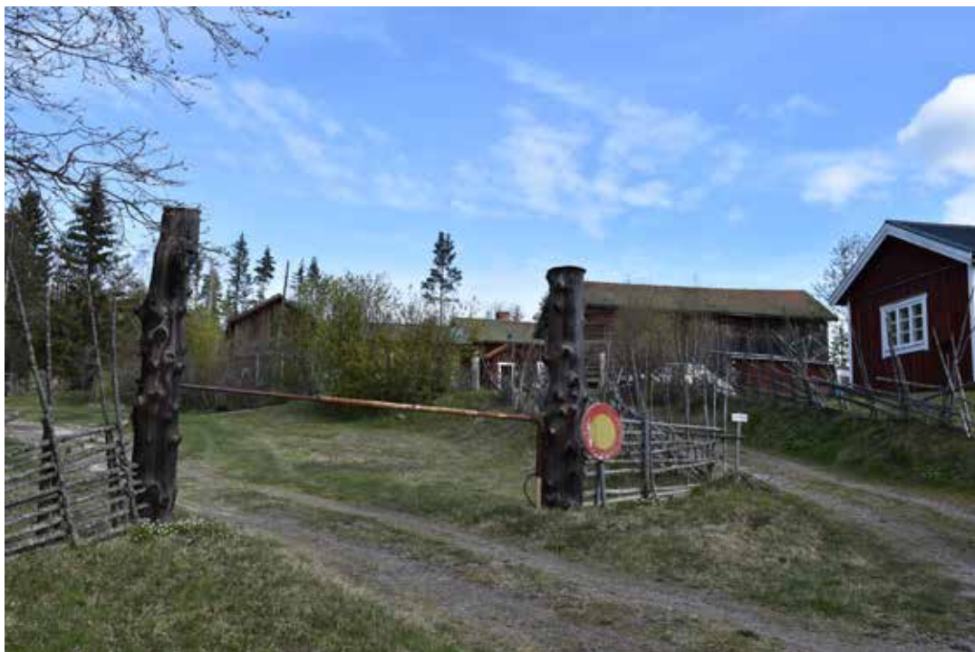
Rotvirkesstolpar och gärdesgård inhägnar en kringbyggd gård högt upp i byn. Östra Rönnäs 17:13.