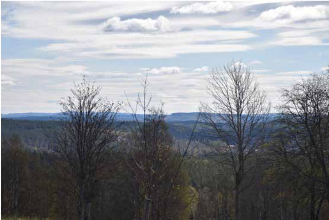
Vida utsikter från toppen på Hackmorkull, vars sluttning Hackmora breder ut sig över.