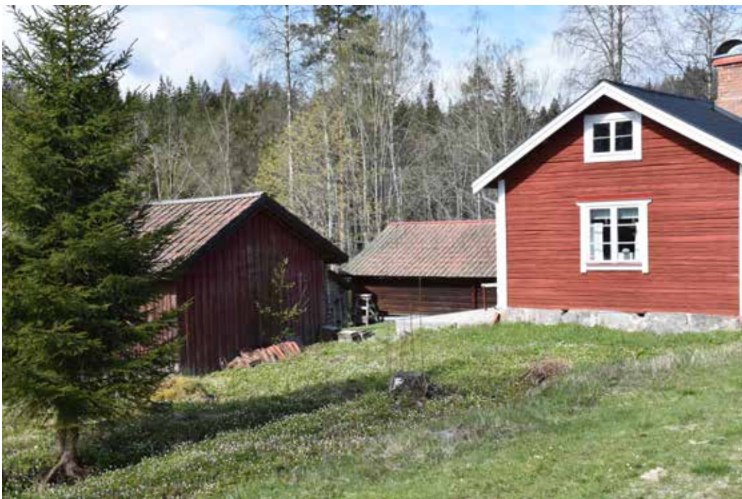
Äldre fyrkantsbyggd fäbodgård med rödfärgad enkelstuga samt stall med portlider, tröskloge och fäjs. Ullvi 3:5.