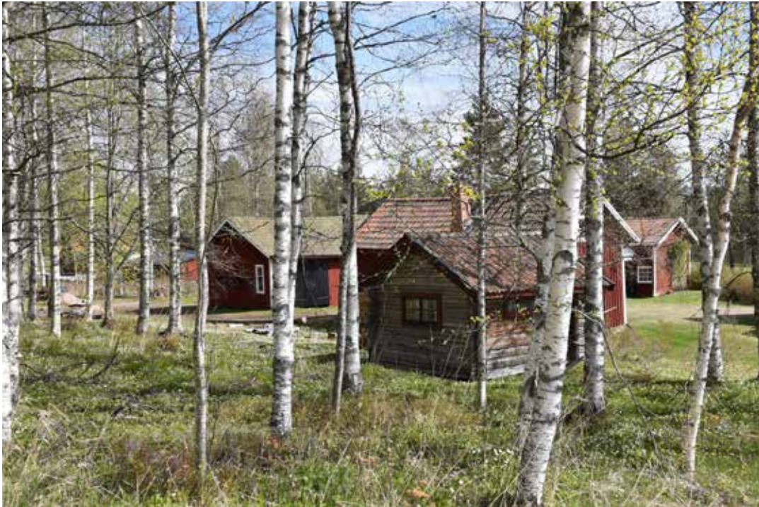
Gytter av tätt stående stugor och ekonomibygnader längre ner i Hackmora by. Östra Rönns 31:5.