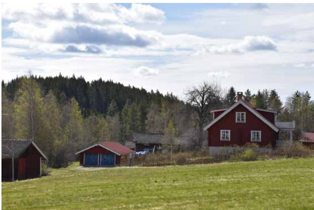
Större villa uppförd under det sena 1900-talet med tillhörande trädgård och knuttimrat garage. I bakgrunden skimtar en ålderdomlig kringbyggd gårdsmiljö. Tibble 12:16.