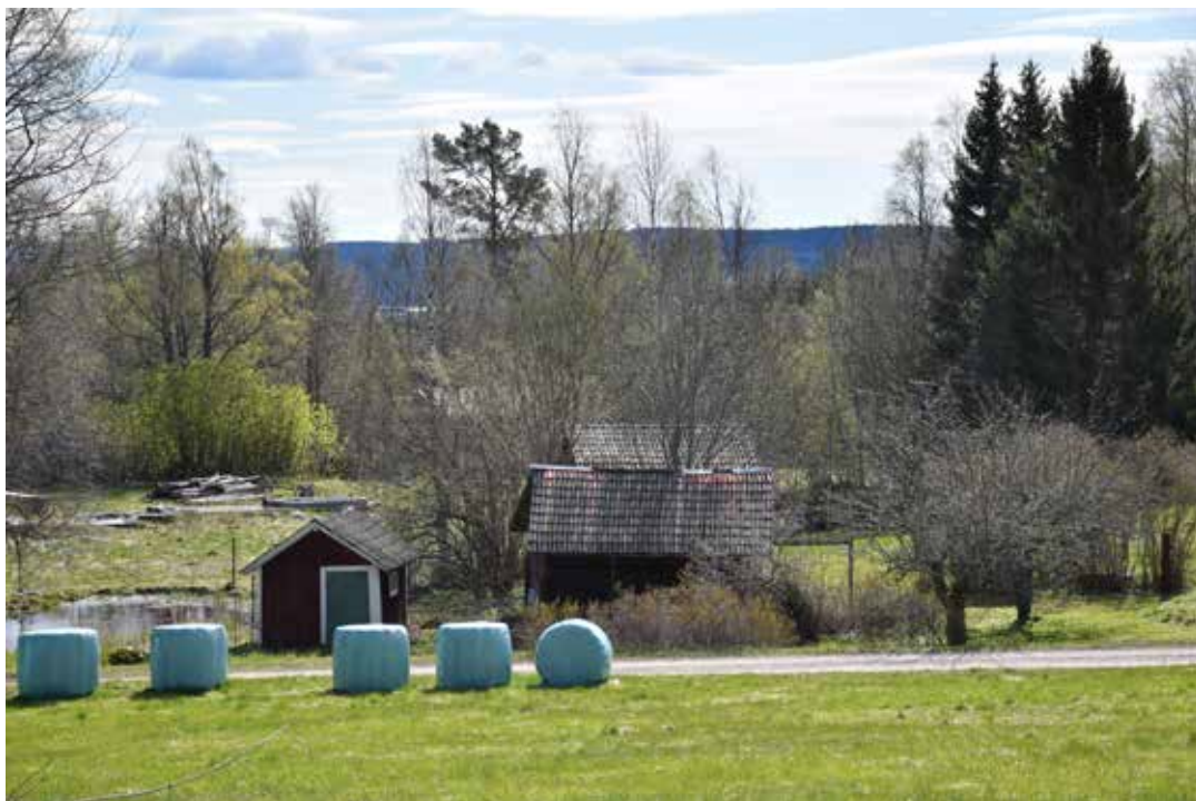
I den centrala delen av byn finns flera öppna grönområden. Många av gårdarna har även fruktträdgårdar. Till vänster skimtar en konstgjord bevattningsdamm.