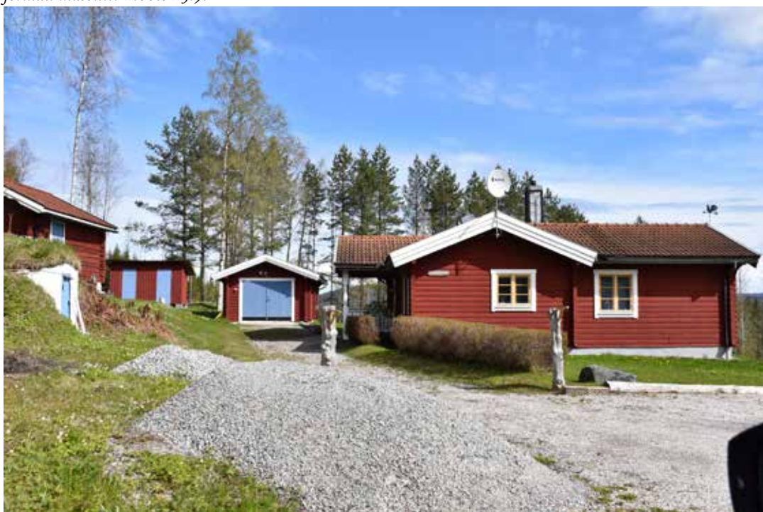
Stuga från det sena 1900-talet i liggtimer med tillhörande gäststuga och garage. Östra Rönnäs 31:12.