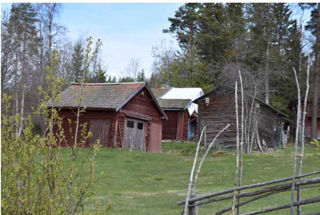
Ekonomibyggnader i brant sluttning. Den röda tröskladan har sedermera gjorts om till garage med bruna portar. Tibble 11:14.