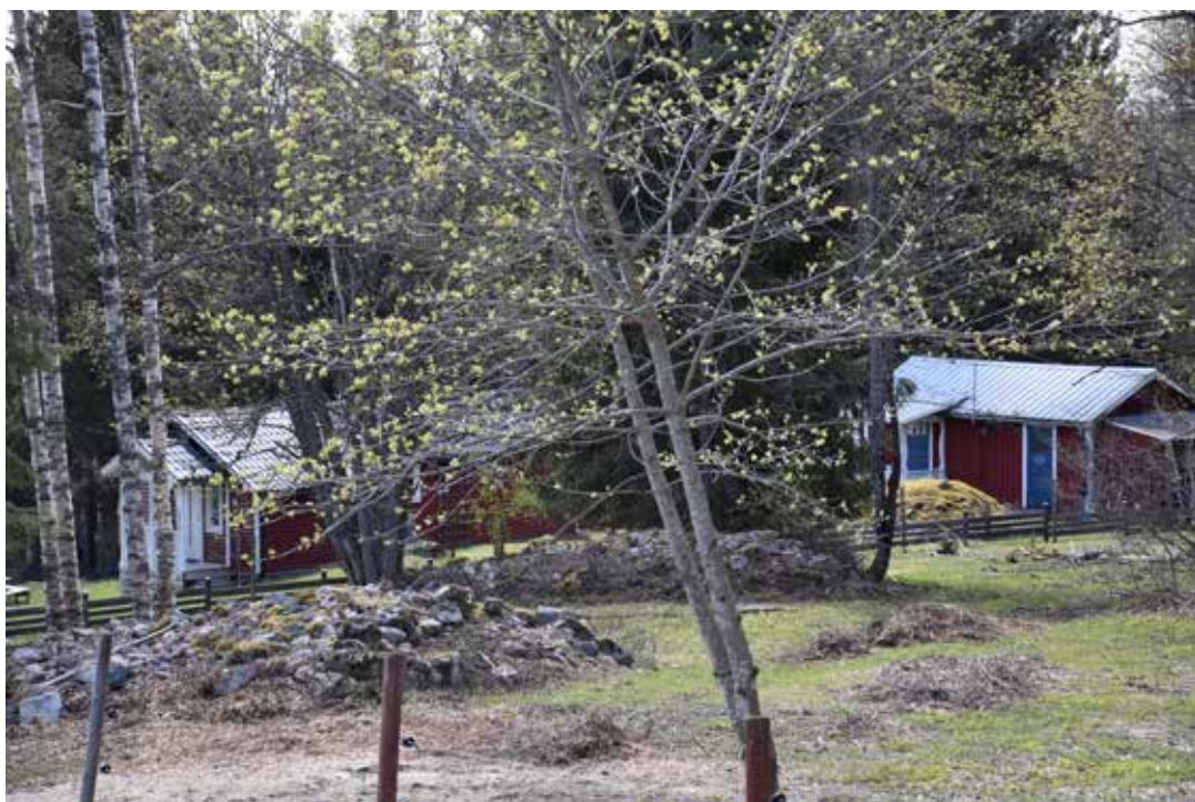
Stora odlingsrösen i vad som idag är betesängar. I bakgrunden skymtar flera fritidsstugor från 1900-talets senare hälft. Ullvi 3:7.