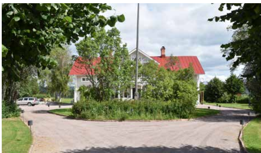
Stor putsad salsbyggnad med mycket höga kulturvärden på Carlstensgården. Byggnaden var tidigare ljusgul. Gärde 1:57.