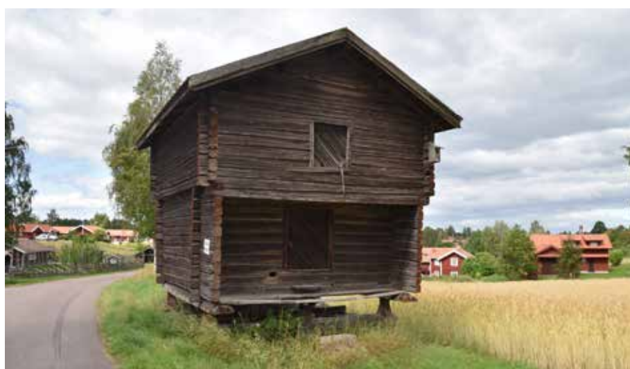
Ålderdomligt gavelhärbre väster om bykärnan. Byggnaden och andra liknande knuttimrade hus av hög ålder är omistliga för förståelsen av timmerhuskulturen i Leksand och bör därför bevaras i befintligt skick. Gärde 18:7.