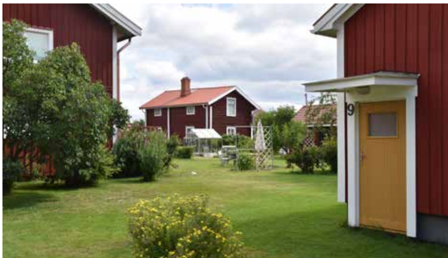
I söder är gårdarna bitvis tätt placerade. I bilden syns en ålderdomlig parstuga, och närmast i bilden ett modernistiskt småhus som anpassats till bymiljön genom färgsättning och materialval. Gärde 5:27 och 2:10.