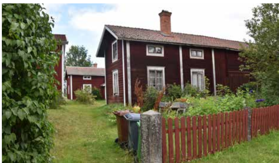
Det är vanligt med äldre välbevarade sekundära bostadshus som är sammanlänkade med ekonomibyggnader. Gärde 9:8.