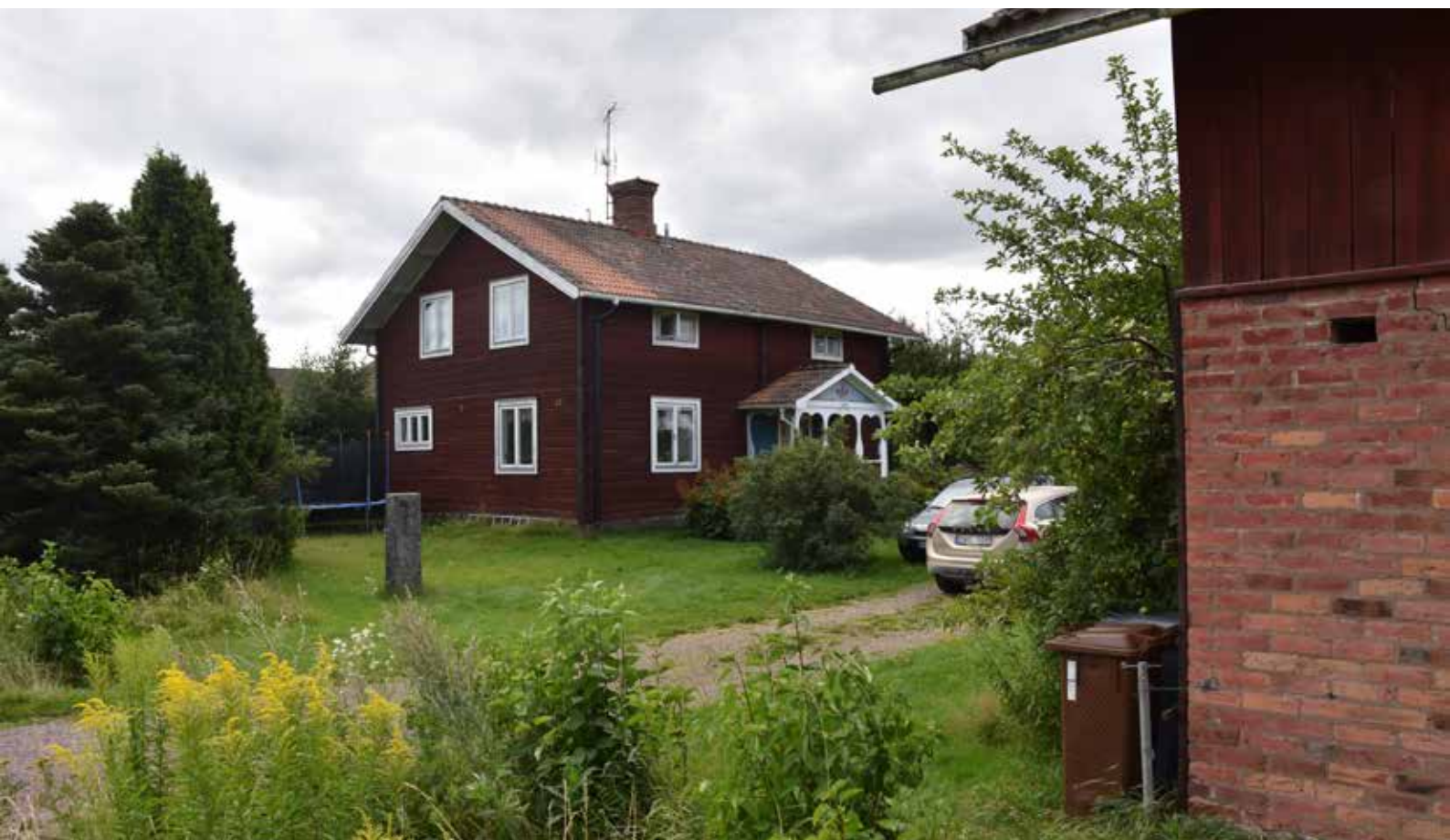
Gård med sen 1800-talskaraktär där korsplanshuset och ladugårdsanläggningen med tegeldel kan berätta om hur gårdsbildningarna förändrades till följd av industrisamhällets intåg i Leksand kring 1870. Gärde 7:10.