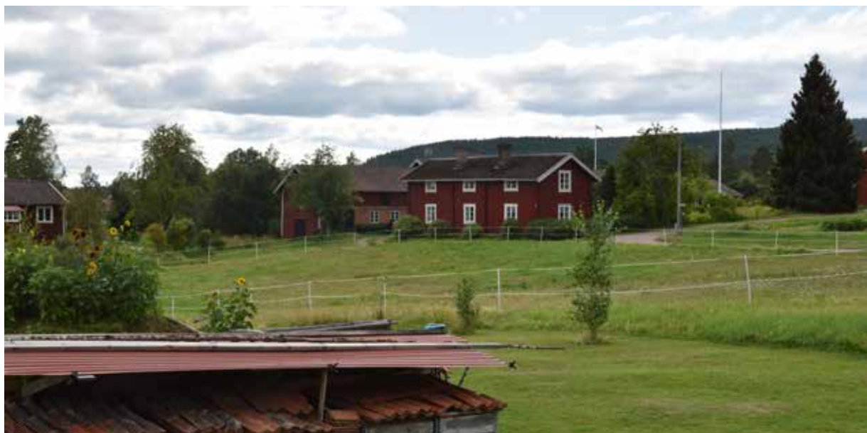
Mer ålderdomlig parstuga, dock med förändrade detaljer, i byns södra del. Gärde 3:6.