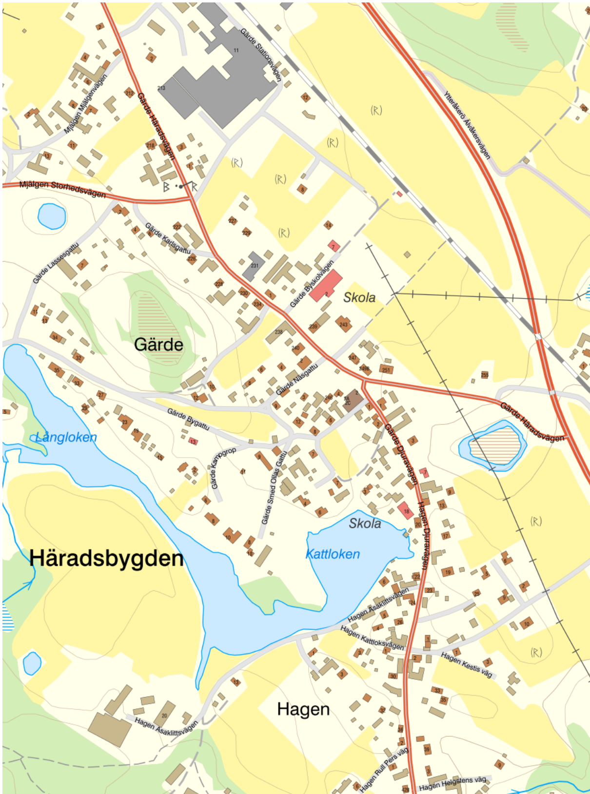
Gärde är beläget i Häradsbygden, mellan Mjälgen i norr och Hagen i söder. I sydväst finns sjön Långloken-Kattloken.