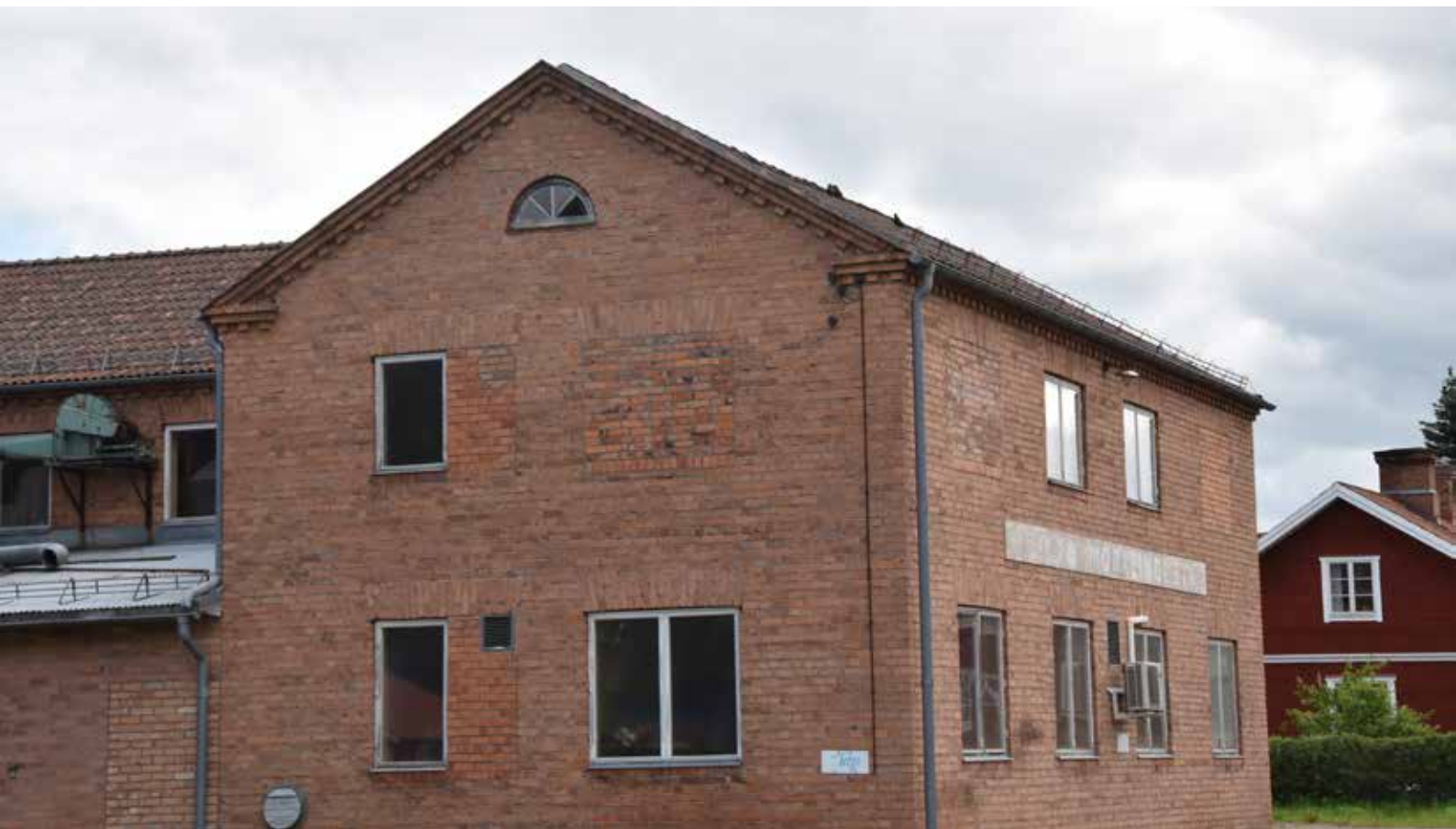
Närbild på Möbelfabriken tegelfasad. De raka fönstervalven och takfoten är karaktäristiska. Gärde 15:17.