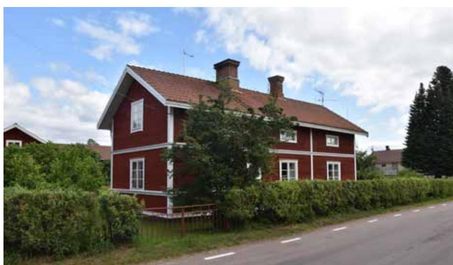
Panelinklädd äldre parstuga i norra delen av byn. Gärde 6:20.