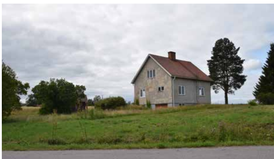
Utanför byn finns en ett ensligt beläget funktionalistiskt småhus. Byggnaden kan berätta om den renodlade funktionalismens utbredning i Leksands byar. Renodlad funktionalism är ovanlig i byarna. Ytteråkerö 25:5.