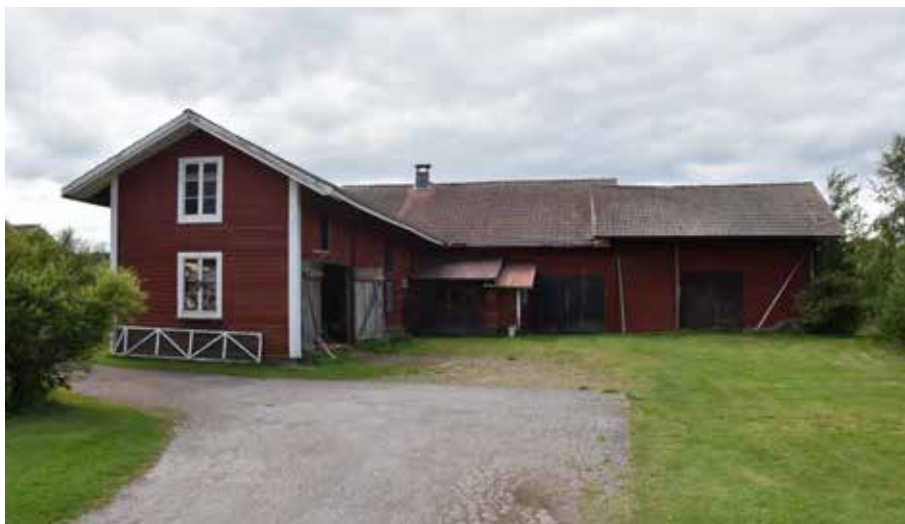
Timmerhus med olika funktioner sammanlänkade i kringbyggda former. Byggnadernas storlekar antyder att de uppförts under 1800-talet. Gärde 22:4.