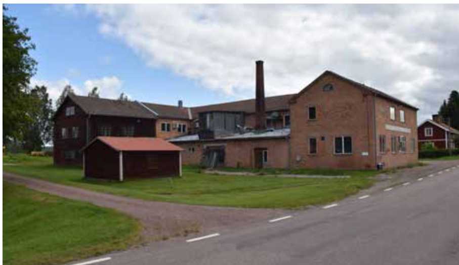
Möbelfabriken i norra delen av byn. Byggnaden karakteriseras av dess tegelfasader och detaljer i densamma. I norr finns en utbyggnad i trä med äldre spröjsade fönster. Det finns även en tegelskorsten med rektangulär form. Gärde 15:17.