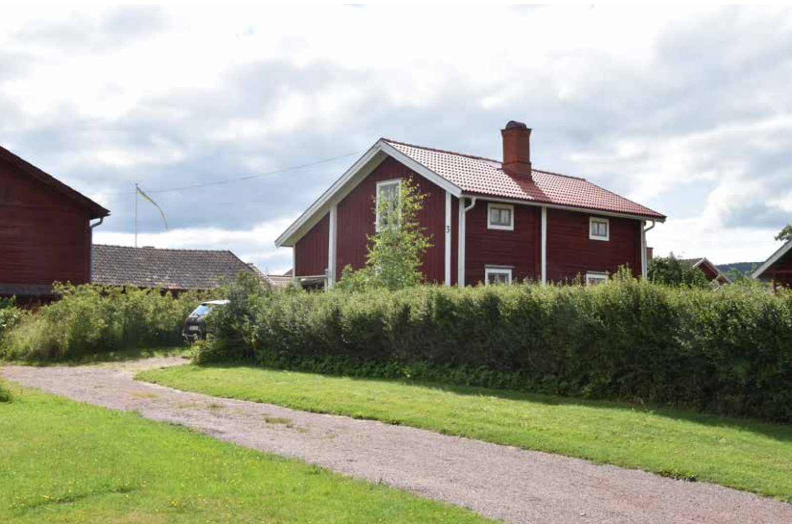
Äldre enkelstuga med delvis välbevarade detaljer. I bakgrunden syns delvis det mycket tätt bebyggda område som finns mellan Näsgrattu och Bygattu. Gärde 5:27.