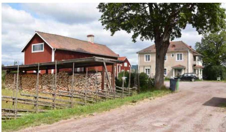
Manbyggnad med reveterad fasad i östra delen av Gärde. Det finns flera reveterade byggnader i byn. Ursprunglig färgsättning på sådan puts går ofta i spekrat ockra, järnvitriol och umbra. Gärde 2:17.