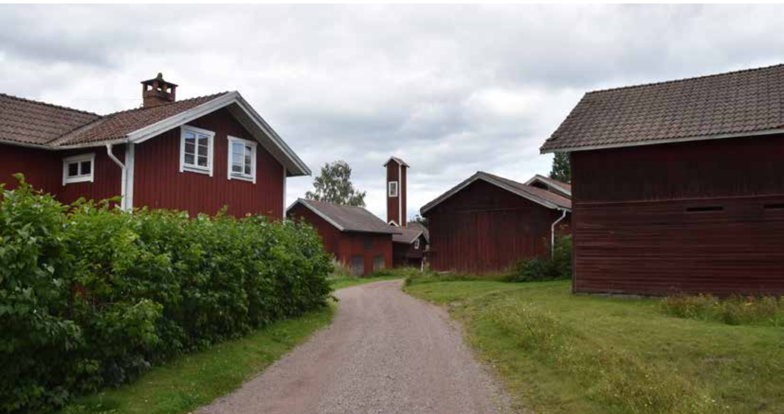
Sluten bebyggelsen i norra delen av byn. Nästan alla hus i byn är byggda i trä, med långsmal form och med sadeltak. Många äldre hus har dock mer eller mindre förändrats under 1900-talet. Det höga tornet är ett slangtorn tillhörande byns brandstation. Brandstationen är belägen på fastigheten Gärde 19:3. Till höger i bilden syns fastigheten Gärde 9:8.