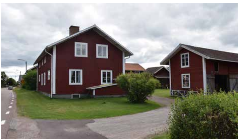
Korsplanshus från sent 1800-tal eller tidigt 1900-tal på en gård med ekonomibyggnader från samma tidsperiod. Detaljer på bostadshuset är dock förändrade, vilket antyder en modernisering kring 1900-talets mitt. Gärde 22:4.