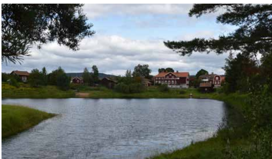
Kattloken med bebyggelse i både Gärde och Hagen. I bildens mitt skymtar den överbyggda tvättbryggan.