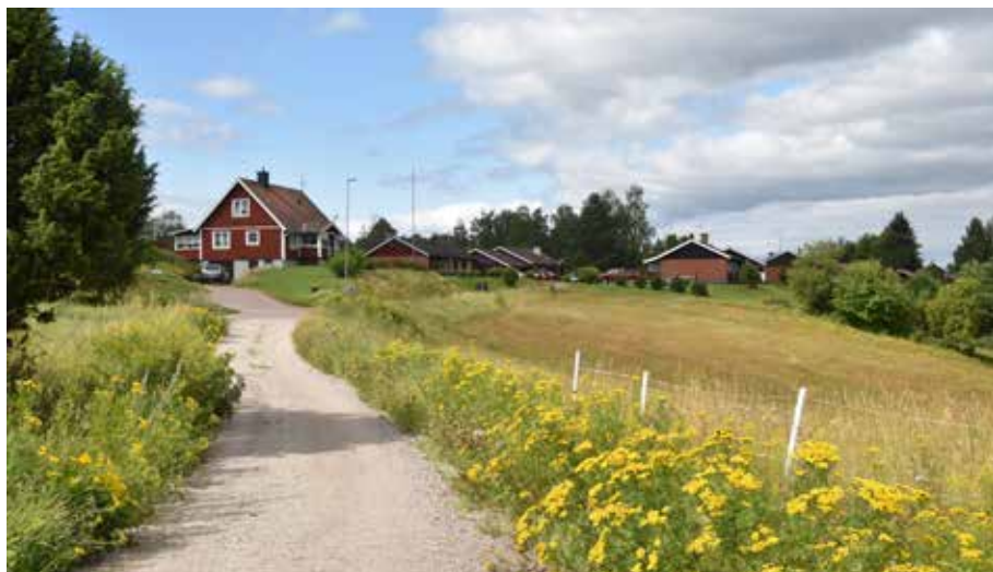
Nordväst om byns huvudklunga finns ännu en åsrygg med bebyggelse, men av delvis avvikande karaktär i form av tegelhus. Gärde 2:6.