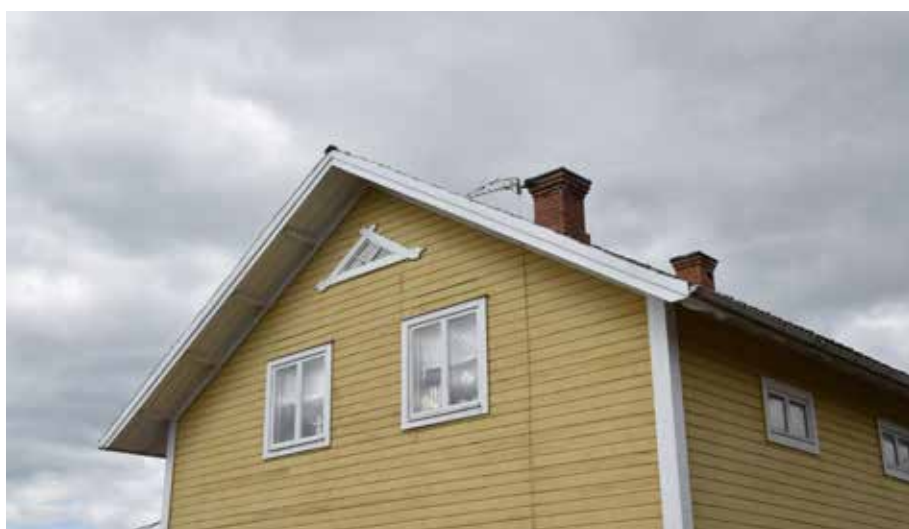
Ljust guldfärgad fasspontad panel på ett korsplanshus i södra delen av byn. Lika som många andra liknande hus har byggnaden moderniserats kring 1900-talets mitt. Gärde 24:3.