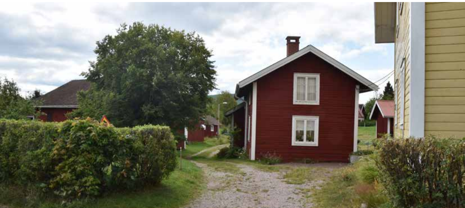
Äldre enkelstuga i byns södra del. Byggnaden står på ett gårdstun som kompletterats med ett korsplanshus under 1800-talets slut eller kring 1900-talets början. På enkelstugans övervåning finns ett äldre bevarat fönster. Gärde 24:3.

Kringbyggd gård med ålderdomliga timmerhus. längst upp från vänster: hölada, parstuga (bostadshus), långsideshärbre, källarstuga, loftbyggnad med portluder, vagnsbod sammanbyggd med kortsideshärbre, tröskloge, brunn, stall, torkhus, smedja, lada och fähus med portluder och dyngstad.