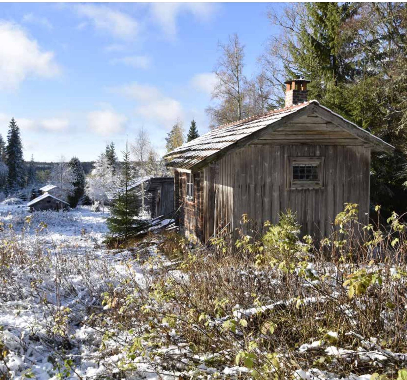
Liten fäbodstuga i Balkbodarnas västra klunga. Byggnaden är ålderdomlig, något som i synnerhet det blyspröjsade fönstret på gaveln vittnar om. Bortom syns vidsträckta utsikter och andra fäbodgårdar. Rältlindor 4:5.