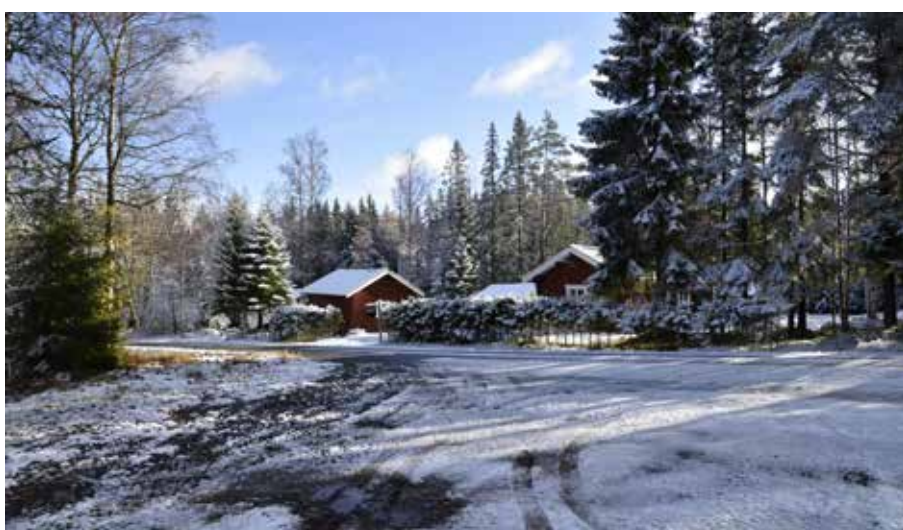
Glest fyrkantsbyggd äldre fäbodgård i södra delen av Lindbodarna. Västannor 29:24.