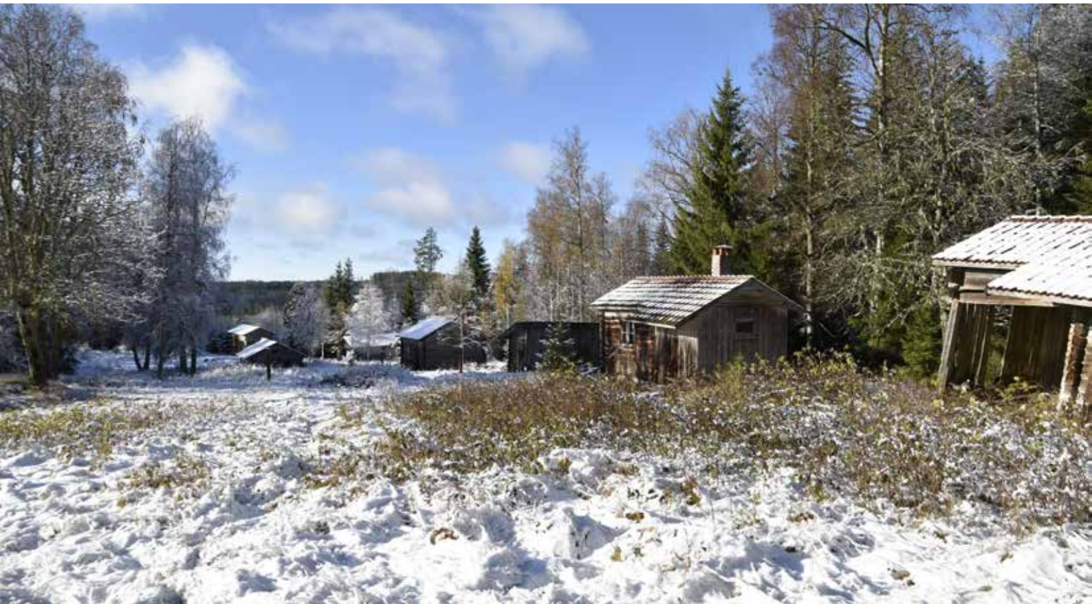
Den västra klungan på Balkbodarna är belägen i en västsluttning med rika utblickar. Fäbodgårdarna är belägna som på rad vid randen av den fortfarande öppna vallen. Bebyggelsen är i sin helhet mycket älderdömlig.