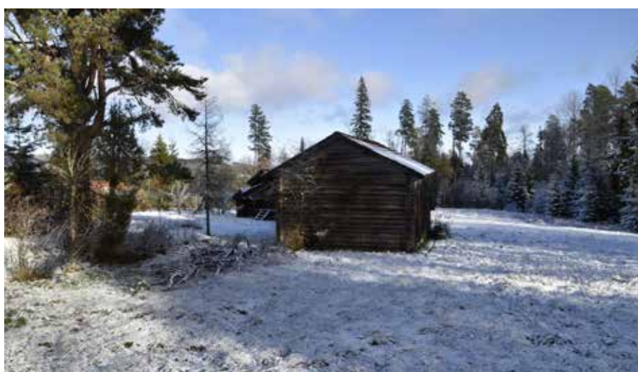
Kvarvarande öppet markavsnitt intill en fäbodgård i Lindbodarna. Byggnaden mitt på bilden är en tröskloge, vilket antyder att spannmålsodling förekommit. Smedby 8:24.