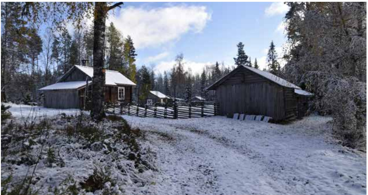
Den östra klungan på Balkbodarna ligger i ett vägskäl mellan tre gamla fäbodstigar. Två av de äldre gårdarna är fortfarande inhägnade med gärdsgårdar. Närmast syns Rältlindor 3:6.