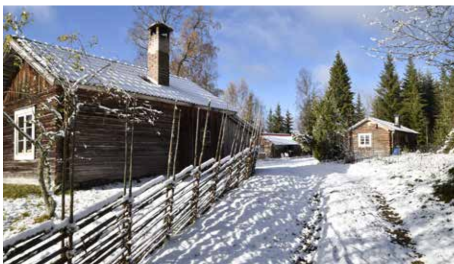
Fäbodstig mellan gårdarna i östra klungan på Balkbodarna. Avgränsningar i form av gärdesgårdar höll djuren från värdefull åker- och slogmark på vägen till och från bete på skogen.