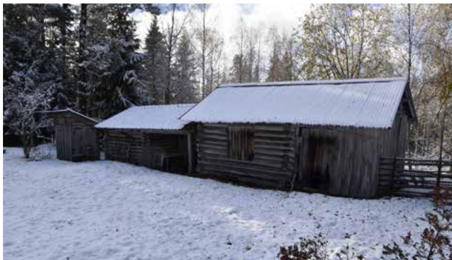
Länga med ålderdomliga timmerhus. Byggnaden i mitten av längan är sannolikt en lövlada och kan vara av hög ålder. Råltindor 3:6.