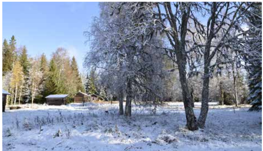
Vid den västra klungan på Balkbodarna finns fortfarande öppen vall och en mångfald av lövträd som kan ha nyttjats till vinterfoder i djurhållningen.