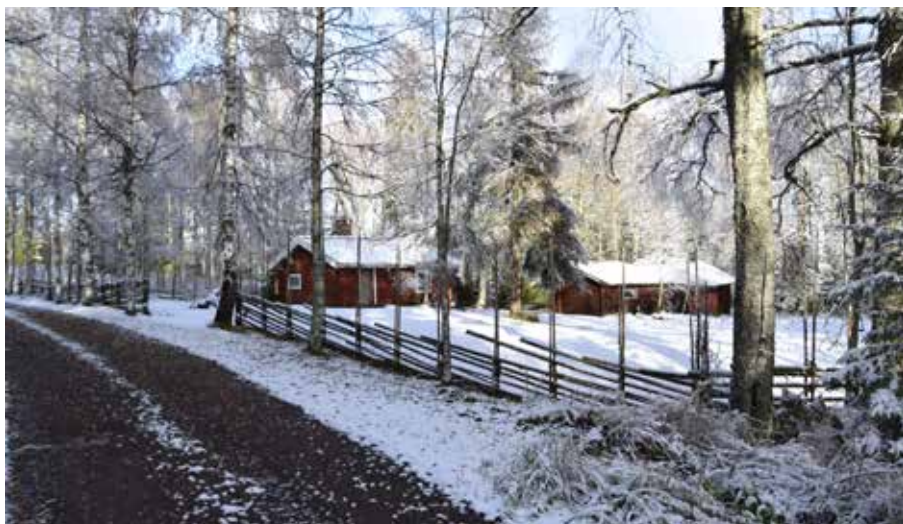
Fäbodgård vid anfartern mot den norra delen av Lindbodarna. I Lindbodarna finns fler fäloröda byggnader än på många andra fäbodställen. Heden 5:9.