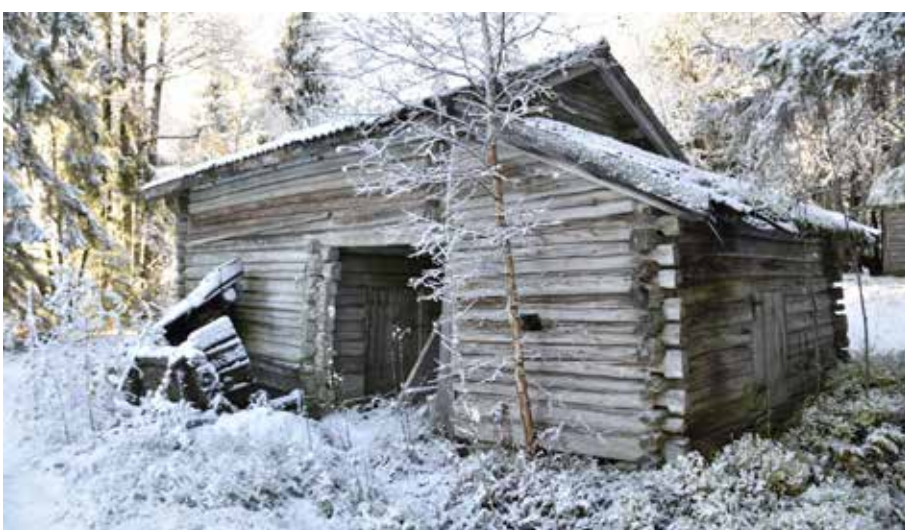
Stall med portlider och foderbod ovan. Djura 12:7. Det finns många välbevarade äldre timmerhus på fäbodstället.