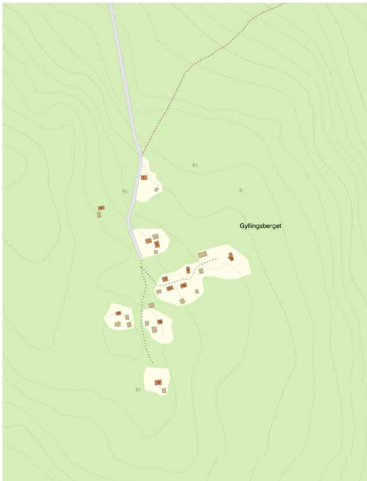
Gyllingsbergets fäbodgårdar med gles klungform. Hela fäbodstället är beläget i östslutningen till Gyllingsberget.