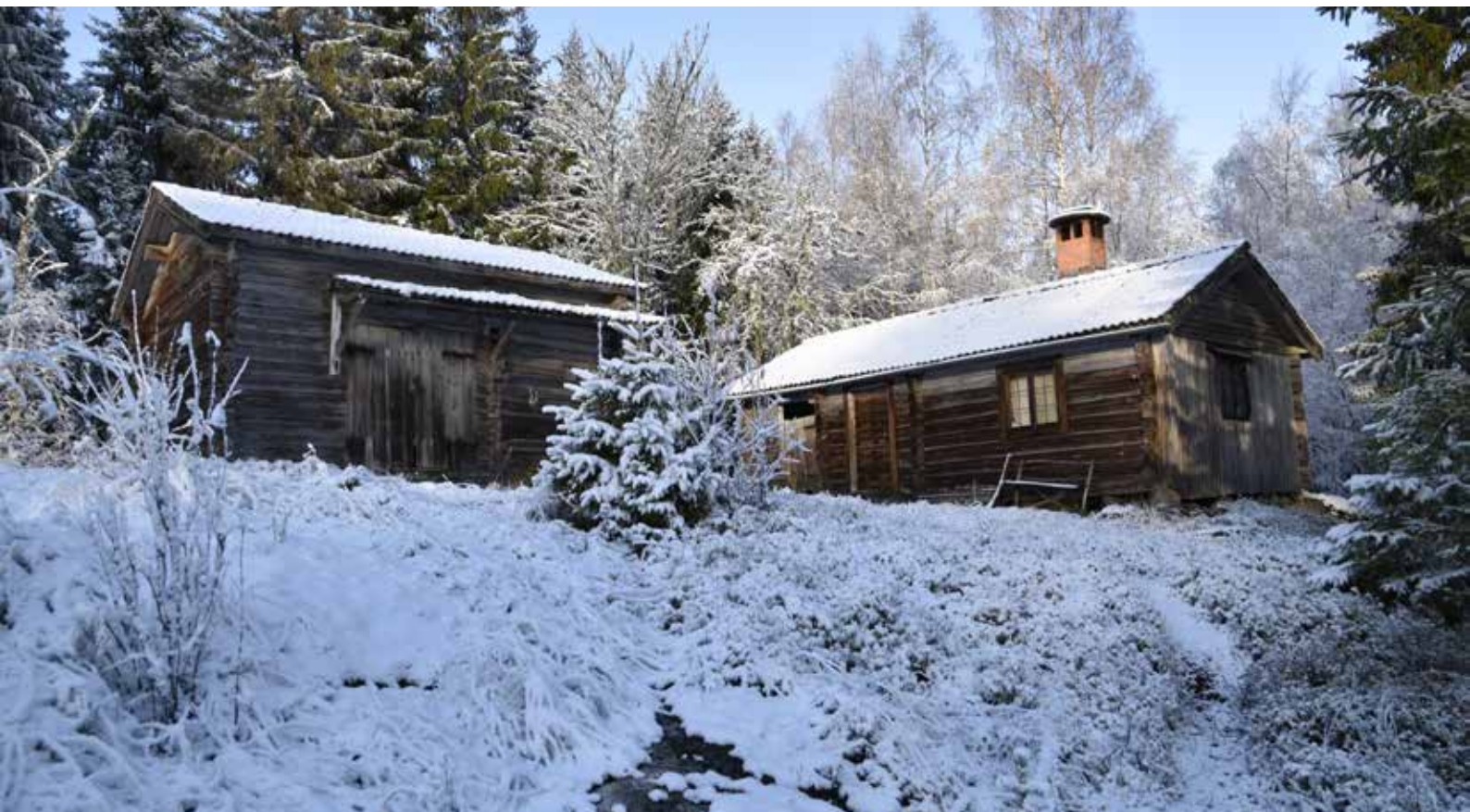
För fäbodstället typisk gård med enkelstuga i vinkel till större tröskloge. Enkelstugan (till höger) har ålderdomliga blyspröjsade fönster, och är som brukligt på fäbodstället tillbyggd med ett vedlider mot kortsidan. Gråda 7:17.