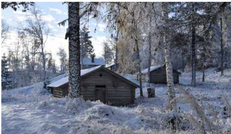
Två äldre fäjs belägna i slutning, på fastigheterna Gråda 11:6 och Gråda S:15.