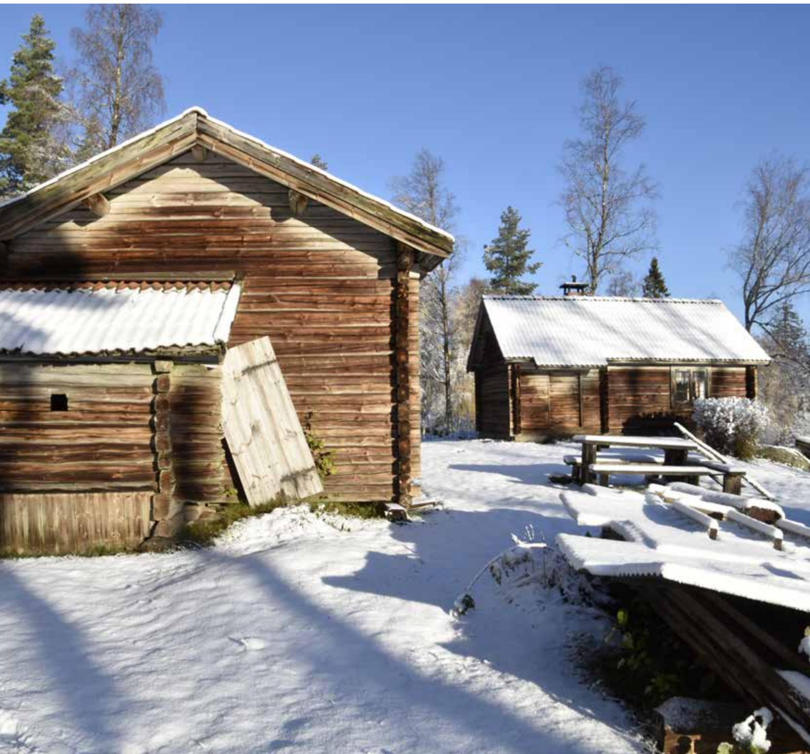
Välbevarad enkelstuga till höger och tröskloge med avträde till vänster. Husen är i timmer och alla byggnader utom en på fäbodstället är ofärgade. Gråda S.15.