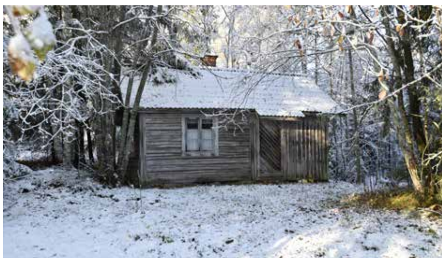
Nätt enkelstuga med laxade knutar (släta mot fasaden) bakom brädklädnad. Djura 12:7.