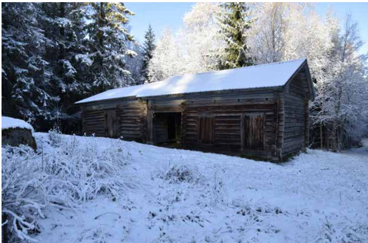
Länga med ålderdomlig tröskloge samt stall med portluder och foderbod ovan. Många ålderdomliga timmerhus har bevarats på fåbodstället. Gråda 10:10.