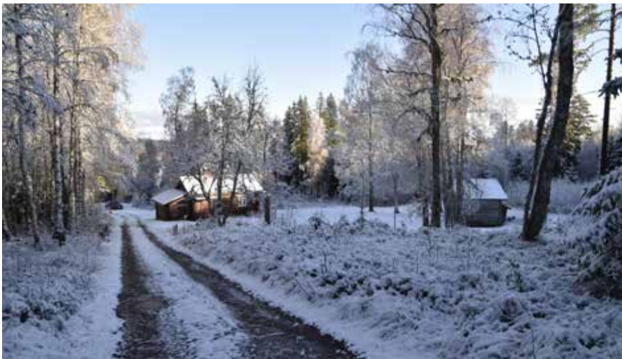
Den nordligast belägna fäbodgården med välbevarad äldre enkelstuga intill den nuvarande anfartern från Brändan. Slutningsläget är påtagligt. Gräda 2:14.