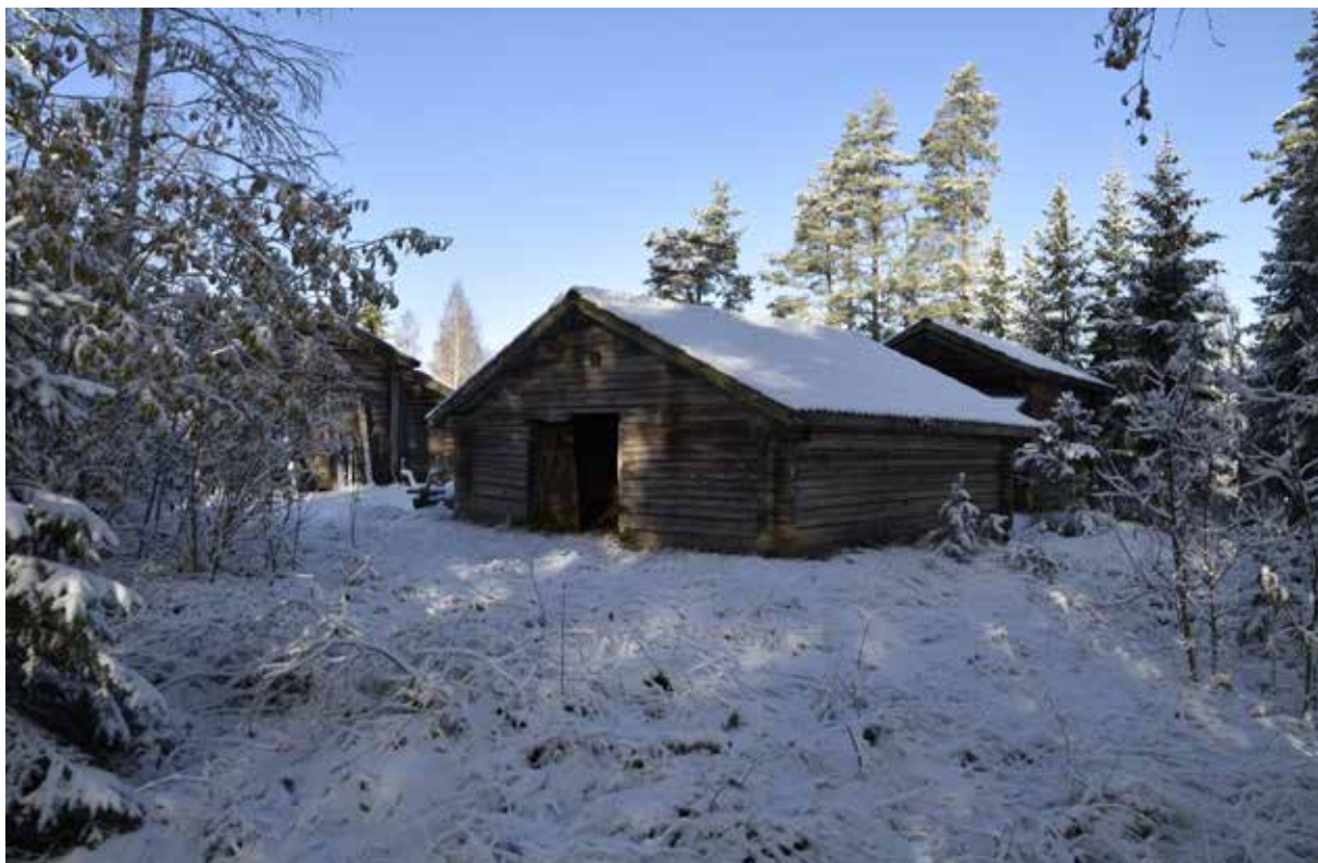
Kringbyggd gård på hol i den västra delen av byn. På gården finns ett av fäbodställets bevarade äldre fäjs (närmast i bilden) samt även lada, loge och enkelstuga. Gråda 6:15.