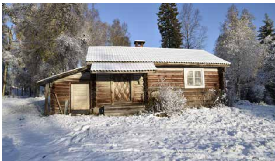
Enkelstuga med ytterdörr som är försedd med profilvermålade brädor i romb-mönster. Den ålderdomliga dörren är mycket viktig för byggnadens karaktär. Gråda 11:6.