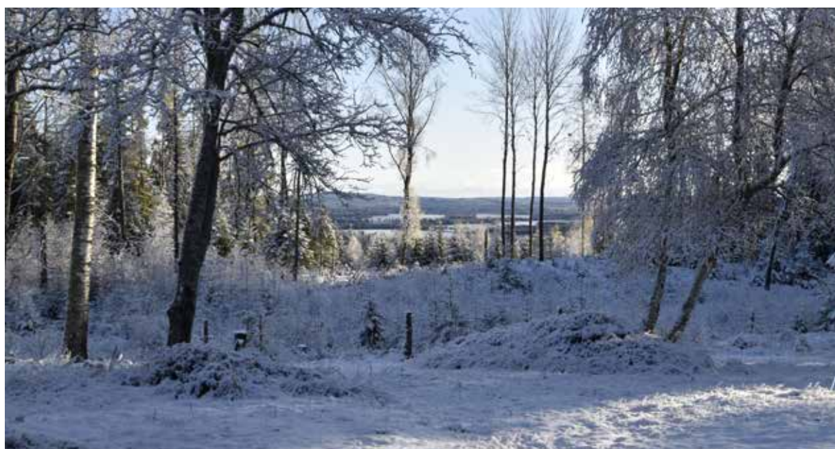
Den storslagna utsikten mot Djura och Gagnefs slättlandskap.